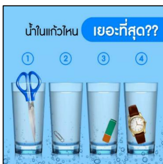
ภาพที่ 1 เปรียบเทียบน้ำในแต่ละแก้ว

ฉะนั้น หากพิจารณาโดยหลักการแล้ว การตัดสินใจถือเป็นส่วนหนึ่งของการแก้ปัญหา เพราะจะเห็นได้ว่า ขั้นตอนของกระบวนการตัดสินใจก็เป็นไปในทิศทางเดียวกันกับการแก้ปัญหา เพียงแต่หลักการเหล่านี้จะไม่ยมนำมาใช้กับการตัดสินใจปัญหาพื้นฐานทั่วไป เช่น หากเลือกรับประทานอาหารโดยการประเมินแคลอรีที่เกิดขึ้นระหว่างข้ามมันไก่กับเย็นตาโฟ หรือการเปรียบเทียบปริมาณน้ำในแต่ละแก้ว ดังปรากฏในภาพที่ 1