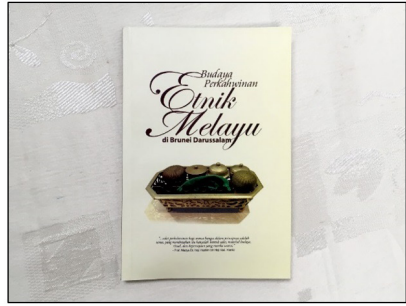
ภาพที่ 2 หนังสือที่เกี่ยวข้องกับมรดกทางวัฒนธรรมที่จับต้องไม่ได้ของประเทศบรูไน (ภาพถ่ายจากการสำรวจภาคสนามเมื่อวันที่ 16 กุมภาพันธ์ พ.ศ. 2560)

นอกจากผลงานวิจัย งานวิชาการ เช่น เอกสาร หนังสือต่าง ๆ แล้ว ประเทศบรูไนยังจัดแสดงวัตถุสิ่งของที่เกี่ยวข้องกับมรดกทางวัฒนธรรมที่จับต้องไม่ได้ในพิพิธภัณฑ์ เช่น พิพิธภัณฑ์เทคโนโลยีมาเลย์ ฯลฯ วัตถุจัดแสดงโดยมากเป็นสิ่งที่เกี่ยวข้องกับวิถีชีวิตของชาวบรูไน ได้แก่ อุปกรณ์เครื่องมือเครื่องใช้ในชีวิตประจำวัน การสร้างที่อยู่อาศัยด้วยภูมิปัญญาท้องถิ่น การทำงานช่างฝีมือแบบต่าง ๆ ซึ่งล้วนแล้วแต่เป็นศิลปะโบราณของบรูไนแทบทั้งสิ้น